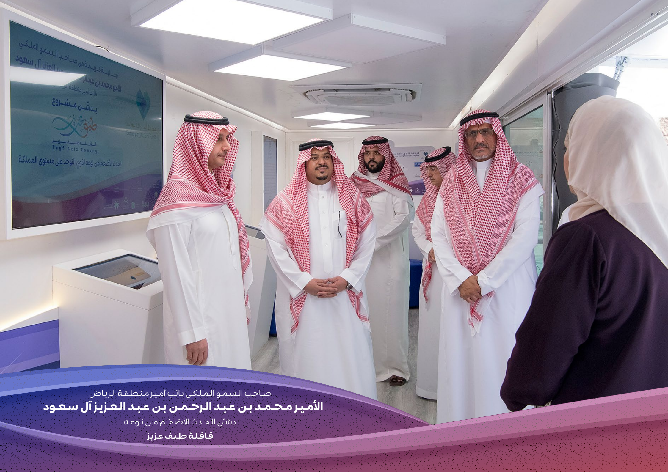
صاحب السمو الملكي نائب أمير منطقة الرياض الأمير محمد بن عبد الرحمن بن عبد العزيز آل سعود دشن الحدث الأضخم من نوعه قافلة طيف عزيز